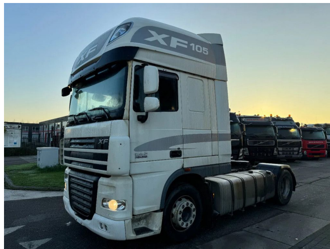
DAF XF 105.460 4X2 - EURO 5 + MANUAL GEAR