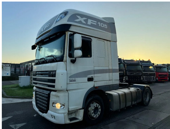
DAF XF 105.460 4X2 - EURO 5 + MANUAL GEAR