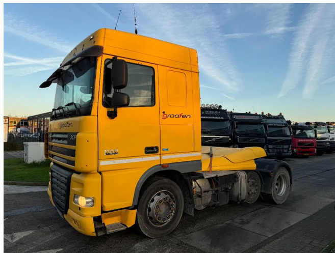
DAF XF 105.460 6X2 - EURO 5 + LIFTING AXLE