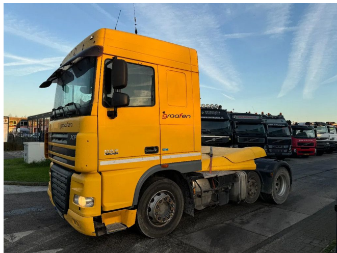
DAF XF 105.460 6X2 - EURO 5 + LIFTING AXLE