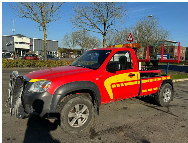
Mazda BT-50 4X4 + TOW TRUCK + DOUBLE WINCH + RE...