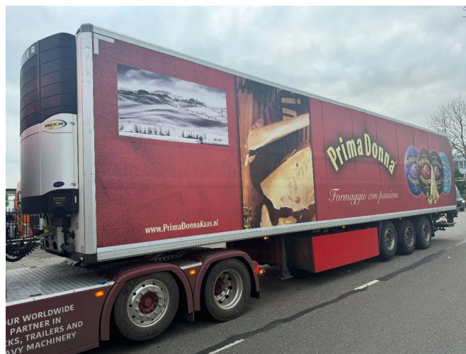
Krone SD + CARRIER VECTOR 1850 + DHOLLANDIA 3X S...