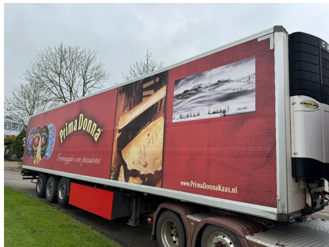
Krone SD - CARRIER VECTOR 1850 + 3X SAF AXLE + LIFT...