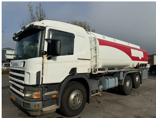
Scania P114-380 6X2 - EURO 3 + 3 CAMBER + RETARDER ...