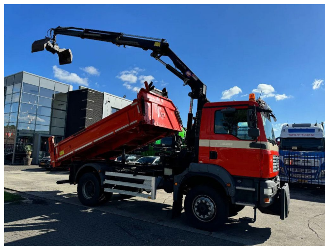
MAN TGM 18.280 4X4 + HMF 1500 + REMOTE + TIPPER + ...

• ABS • Aire acondicionado • Resina de piso • Cojín de