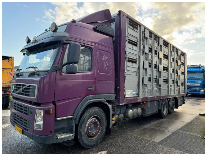
Volvo FM 300 6X2 - LIVE STOCK - 4 LAYERS MOVING FLO...