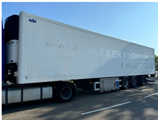
Sor 3 AS + CARRIER VECTOR 1850 + LOADLIFT + STEERI...