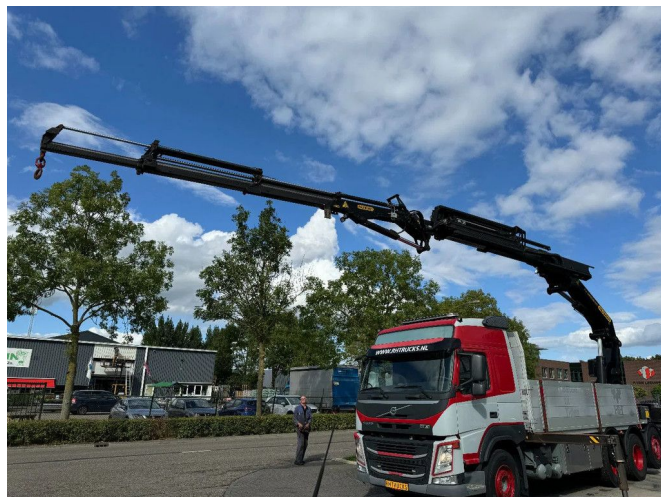
Volvo FMX 460 8X4 PALFINGER PK53002 + FLY JIP AN RE...