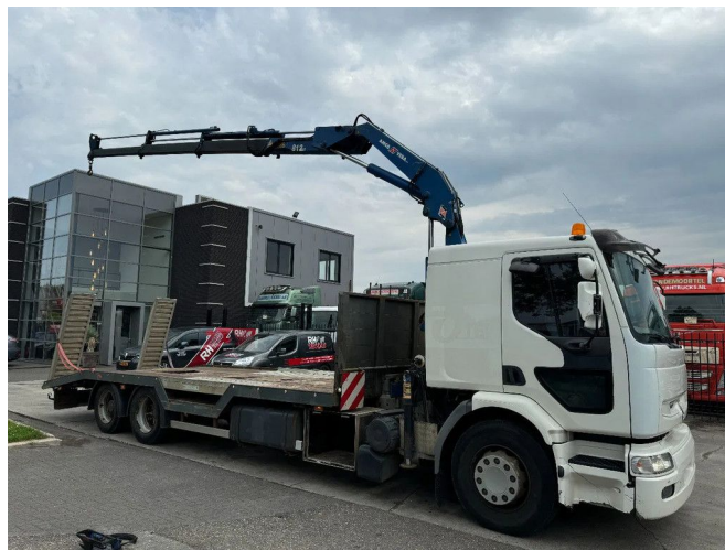
Renault Premium 370 6X2 + AMCO VEBA V812 3S CRANE +...