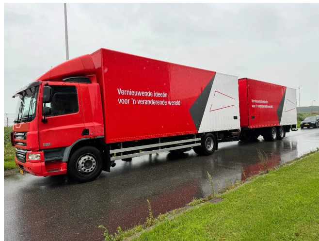
DAF CF 75.310 4X2 EURO 5 + HAPPY AANHANGER + DHO...