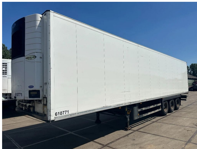
Schmitz Cargobull CARRIER 1850 MT D/E SAF AXELS