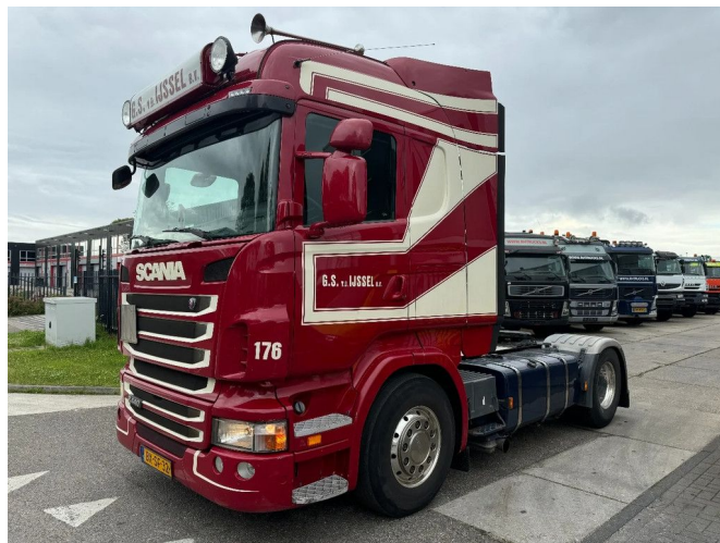
Scania R440 4X2 + ADR + EURO 5 + AUTOMATIC