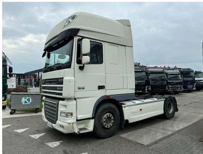
DAF XF 105.460 4X2 EURO 5 HYDRAULIC