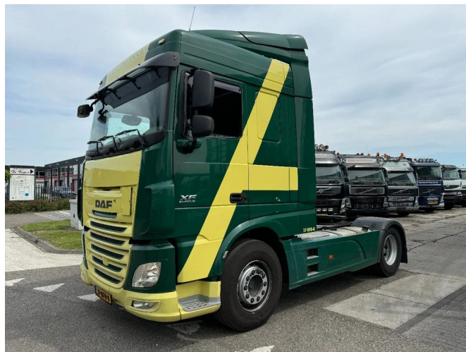
DAF XF 460 4X2 EURO 6 SKIRTS AUTOMATIC