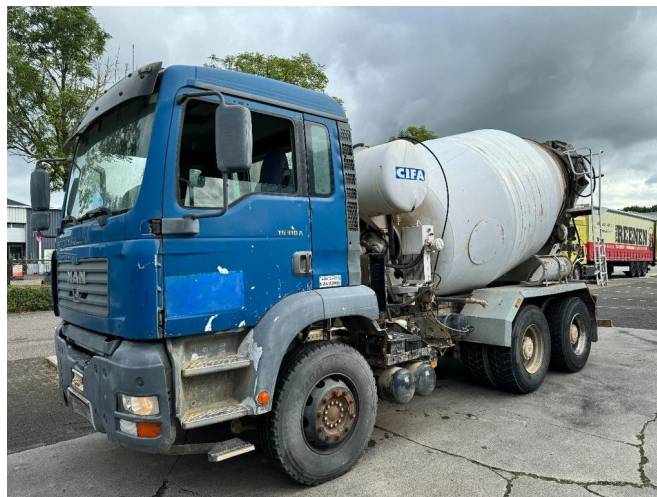
MAN TG 310 A CIFA 6X4 FULL STEEL MANUAL