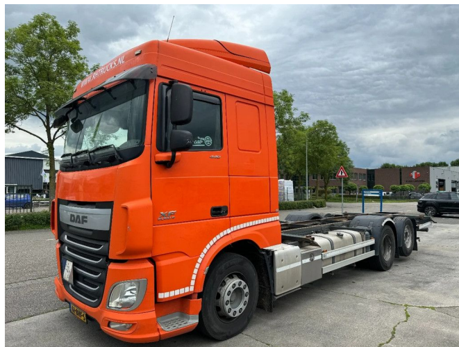
DAF XF 440 6X2 BDF EURO 6 FULL AIR