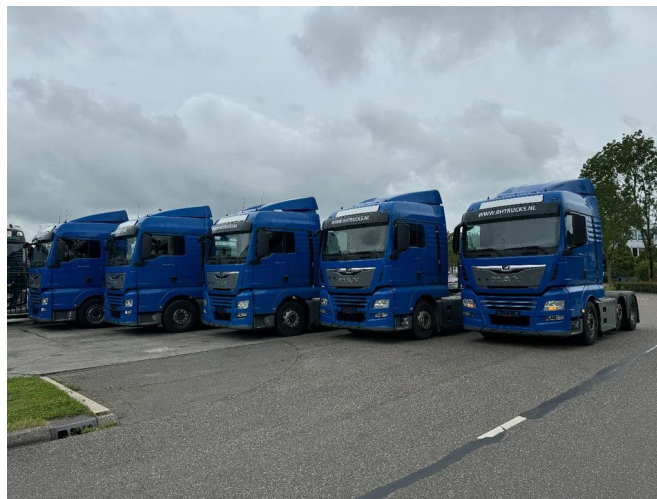
MAN TGX 26.460 XLX 6X2-2 EURO 6 LIFT AXLE