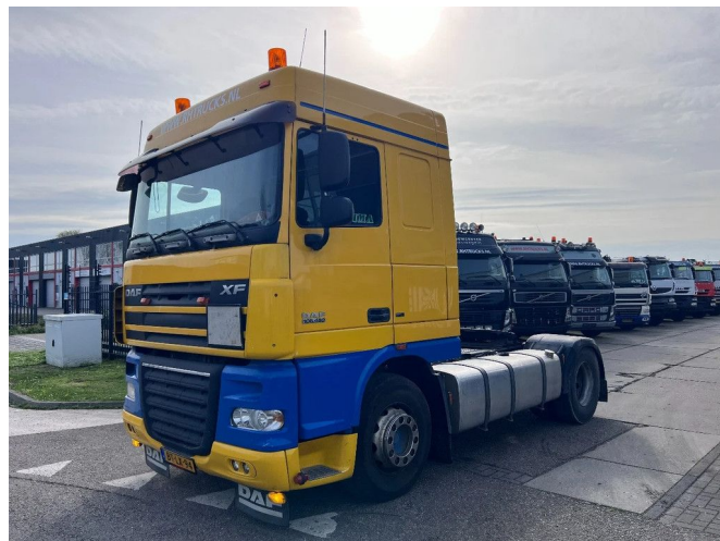
DAF XF 105.460 SC 4X2 EURO 5 MANUAL