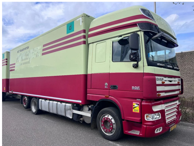
DAF XF 105.410 SSC 6X2 EURO 5 + TRS COOLING