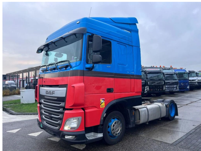
DAF XF 440 SPACE CAB 4X2 EURO 6 MEGA