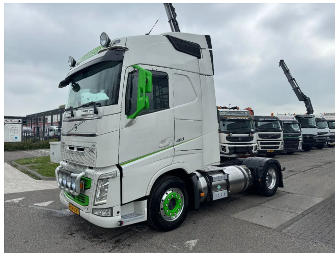
Volvo FH 460 4X2 EURO 6 LNG + DIESEL ALCOA