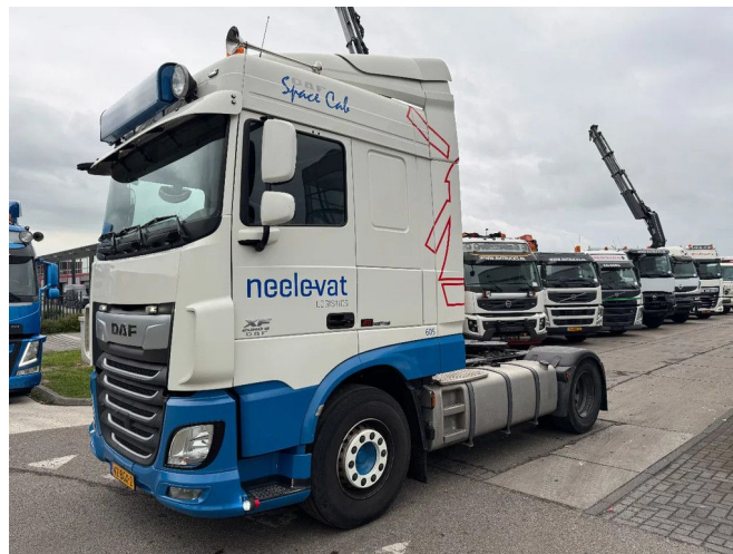
DAF XF 440 4X2 EURO 6 SPACE CAB FRIDGE AIRCO