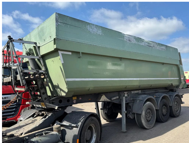
Schmitz Cargobull SGF*3 LIFTING AXLE