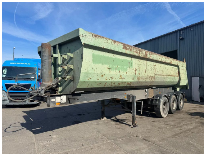
Langendorf 3 AXLE - BPW + TIPPER