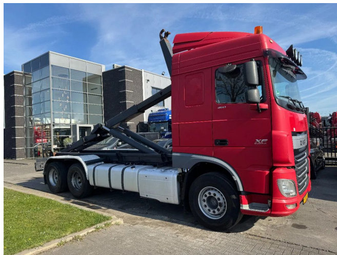
DAF XF 460 6X2 EURO 6 VDL HOOK 20T