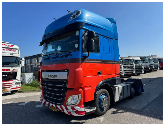
DAF XF 460 6X2 EURO 6 - MANUAL GEARBOX