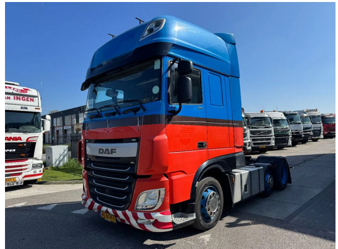
DAF XF 460 6X2 EURO 6 - MANUAL GEARBOX