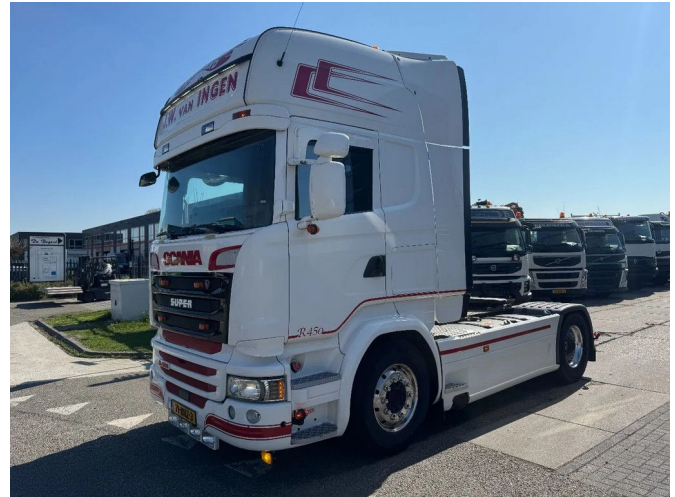
Scania R450 4X2 EURO 6 RETARDER SKIRTS TÜV TILL 01...