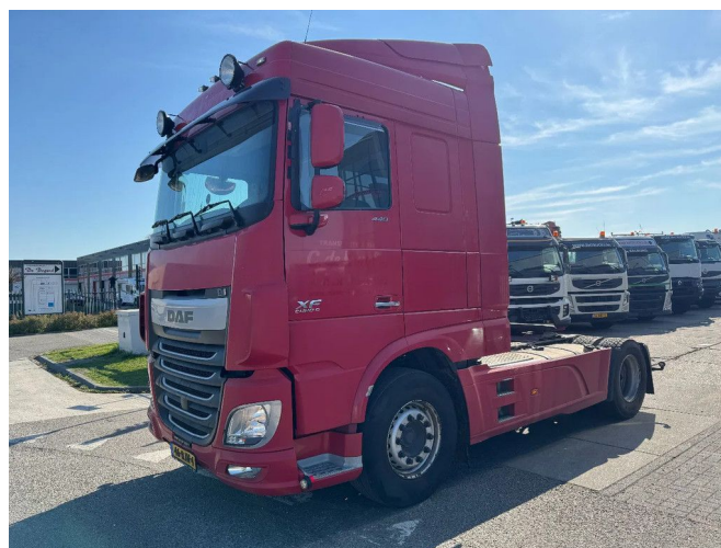
DAF XF 440 4X2 EURO 6 SKIRTS 2017