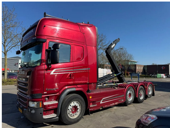
Scania R450 8X2 - EURO 6 + JOAB 24T HOOKLIFT + LIFT/...