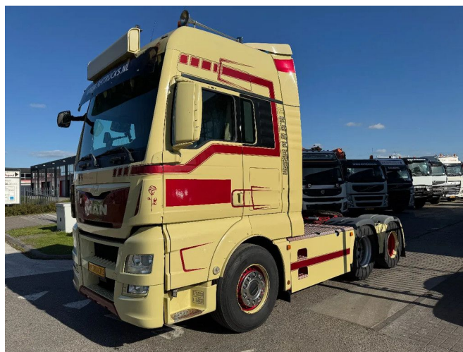
MAN TGX 28.500 6X2 EURO 6 HYDRAULIC SPECIAL INTE... Referentienummer: MA085212