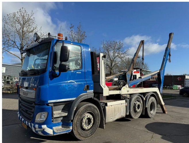
DAF CF 400 6X2 - EURO 6 + VDL P-18 + REMOTE + LIFT A...