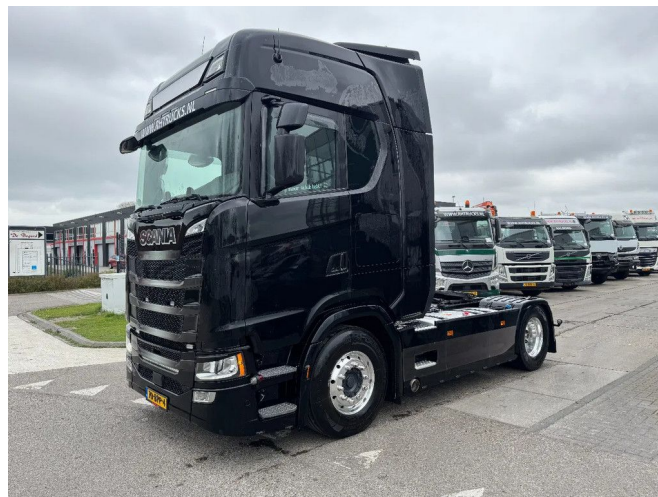
Scania S500 NGS 4X2 RETARDER SKIRTS EURO 6 ALCOA...