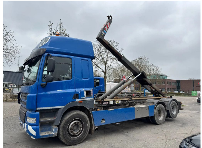
DAF CF 85 6X2 - EURO 5 + VDL HOOK + LIFT AXLE + TÜV ...