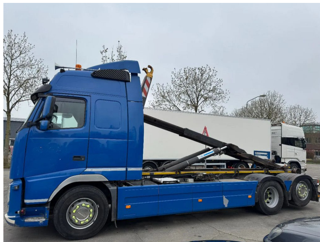
Volvo FH 460 6X2 - EURO 5 + VDL HOOK + LIFTING AXLE