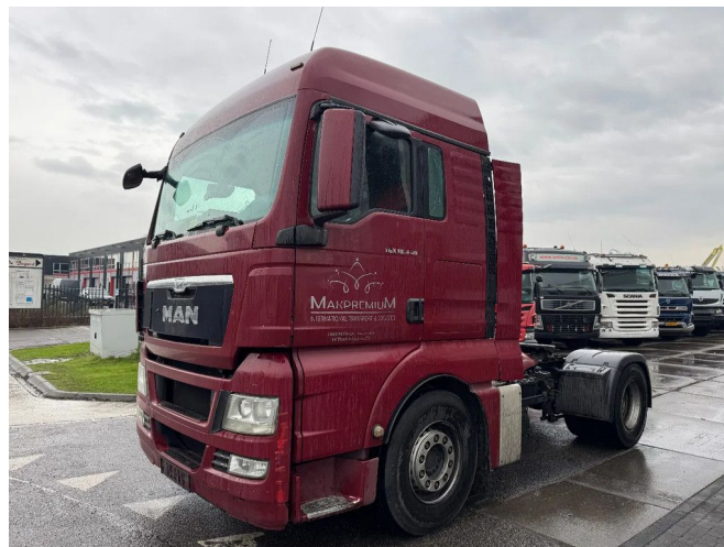
MAN TGX 18.440 4X2 - EURO 5