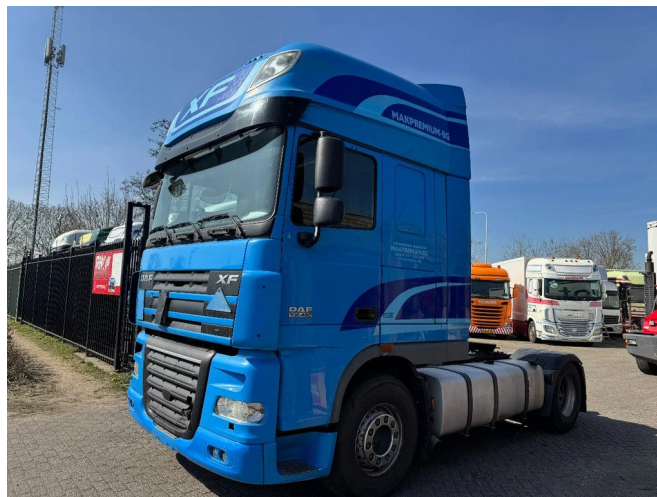
DAF XF 460 4X2 - EURO 5