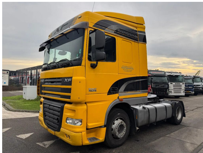
DAF XF 105.410 4X2 - EURO 5