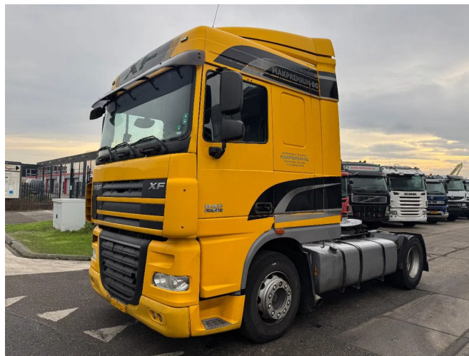
DAF XF 105.410 4X2 - EURO 5