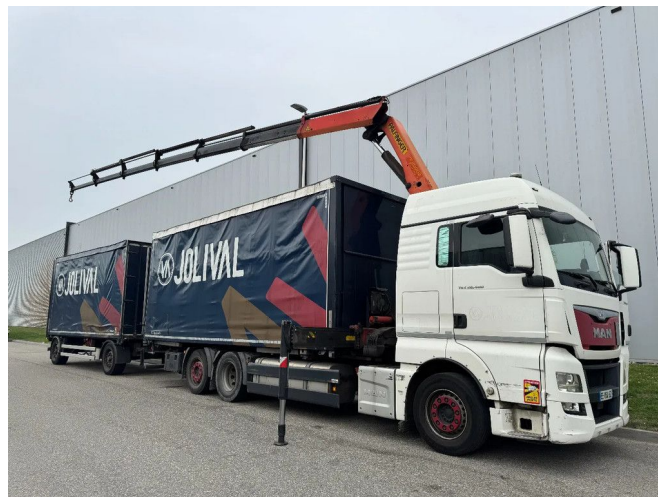
MAN TGX 26.480 6X2 - EURO 6 + PALFINGER PK20002 + ...