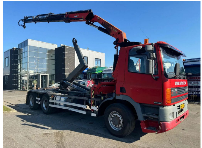
Ginaf M 3232 S 6X2 - EURO 2 + PALFINGER PK19000 + R...