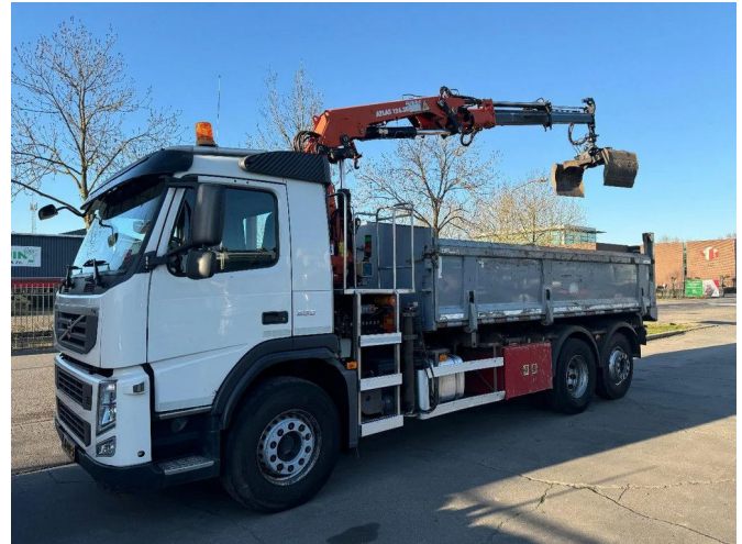
Volvo FM 330 6X2 - EURO 5 + ATLAS 126.3E A2 + REMOTE...