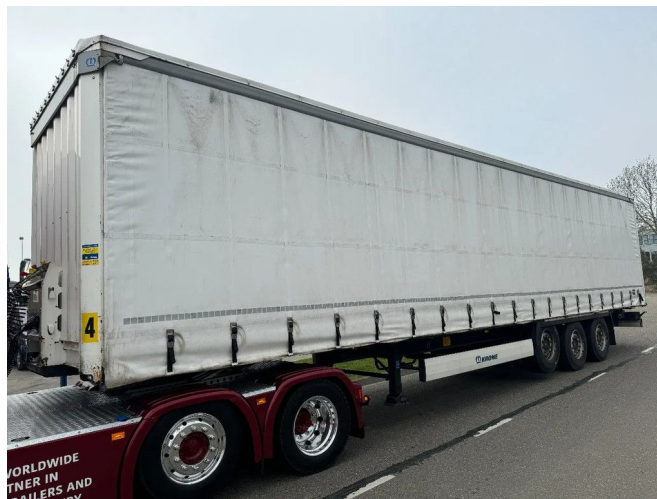
Krone SD 3X SAF AXLE LIFT AXLE TÜV TILL 11-2025