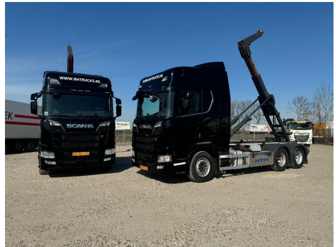
Scania R580 V8 NGS 6X2 EURO 6 VDL 20T HOOK