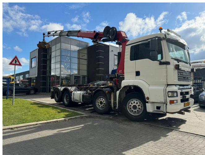
MAN TGA 35.440 8X2 - EURO 4 + HMF 2620K-RC 2018! + ...