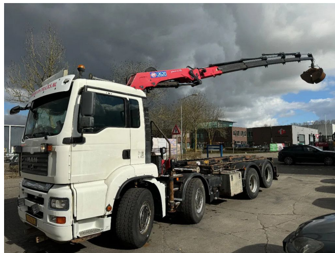
MAN TGA 35.440 8X2 - EURO 4 + HMF 2620K-RC 2018! + ... Referentienummer: MA046832